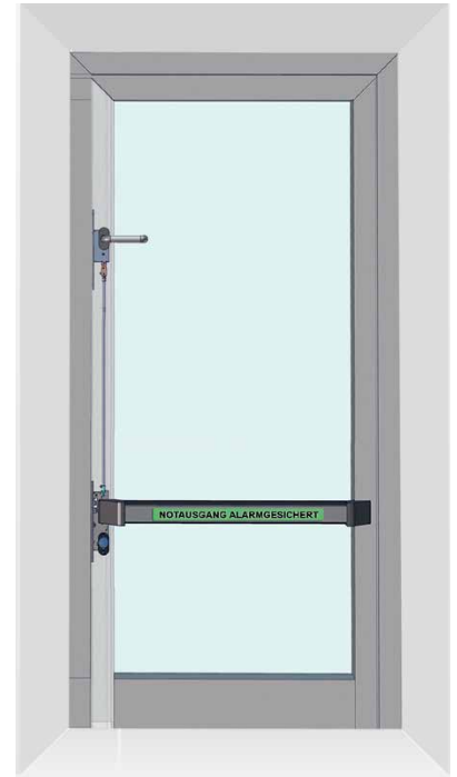
GfS e-Bar® na visini 900 mm